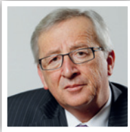
Jean-Claude Juncker Präsident, Europäische Kommission