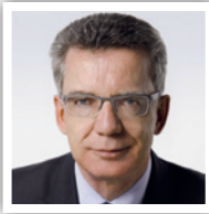
Dr. Thomas de Maizière Bundesminister des Innern