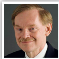
Robert B. Zoellick Präsident a. D., Weltbank