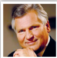
Aleksander Kwasniewski Präsident a. D., Republik Polen