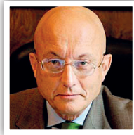
Prof. Dr. Sergei Karaganov Honorary Chairman, Council on Foreign and Defense Policy