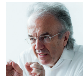
Prof. Dr. Dr. E.h. Dr. h.c. Werner Sobek