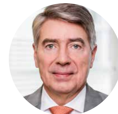
Han Steutel Verband forschender Pharma-Unternehmen (vfa)