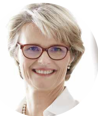
Anja Karliczek Bundesministerin für Bildung und Forschung