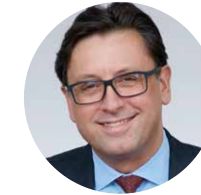
Paul Hudson Sanofi