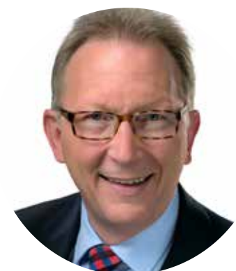
Erwin Rüdell Deutscher Bundestag