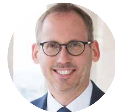
Kai Klose Hessischer Staatsminister für Soziales und Integration