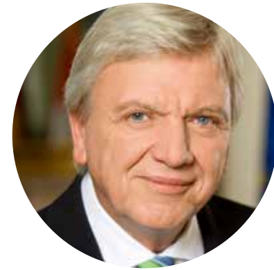
Volker Bouffier Hessischer Ministerpräsident